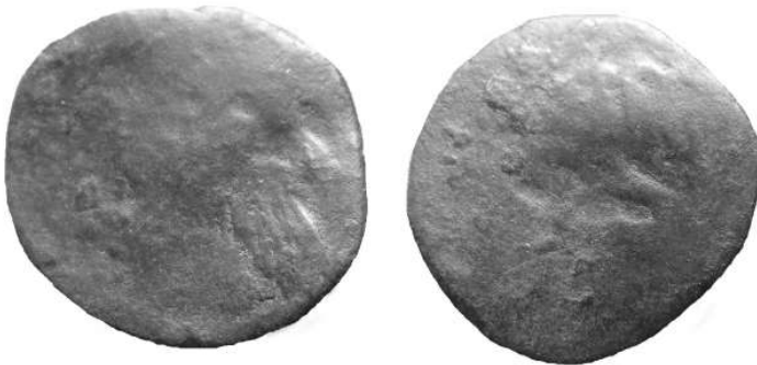
Massa 1,55 g – Ø 17 mm (collectie auteur) (schaal 200%)

Anderzijds zien we ook stukken waarop wel een opschrift staat, maar als we het portret van Karel V vergelijken met dat van officiële stukken blijkt dit minder verfijnd gegraveerd. Vermoedelijk gaat het dan om zgn. ‘imitaties’, d.w.z. stukken die wel degelijk zijn geslagen door muntheren die over het muntrecht beschikten, maar daarbij types van andere heren imiteerden om zo hun munten vlotter – en vaak tegen een iets te hoge koers – in omloop te brengen. Overigens is van sommige heren uit de Maasregio geweten dat ze zich voor hun munt-