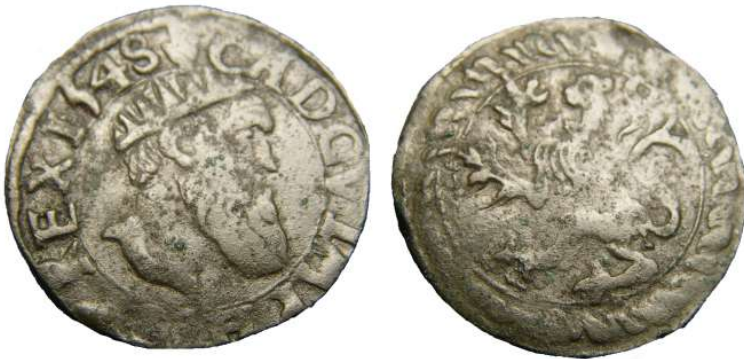
korte geslagen te Antwerpen 1548 – massa 1,63 g – Ø 19 mm

Hij vond dat de korte met portret van Karel V een even modern karakter had als de zilveren gulden. Het was de eerste maal in de Nederlanden dat er een munt van zuiver koper werd vervaardigd. De opzet hierachter was om kleingeld weer hanteerbaar te maken. Voordien bevatten de kleinste munten immers altijd een hoeveelheid zilver waardoor ze door devaluatie steeds kleiner werden.