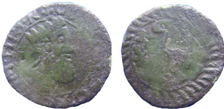
Massa 1,19 g – Ø 17 mm (collectie auteur) (schaal 200%)

Bekijken we de korte hierbij afgebeeld, dan zou deze normaliter, voortgaande op de bestaande literatuur, ook moeten worden toegewezen aan Brugge. Wat echter direct opvalt, is het slecht afgewerkt portret van Karel V. De legende is identiek aan deze van het hiervoor besproken stuk, met dit verschil dat er op het einde een letter R werd toegevoegd. Betreft het hier een verwijzing naar Rekem? Alhoewel er geen kortes met portret van keizer Karel zijn gerepertorieerd voor dit Maaslands hagemuntatelier is het niet uitgesloten dat er wel werden geproduceerd. Het muntmeesterteken is zodanig weergegeven dat het voor meerdere interpretaties vatbaar is.