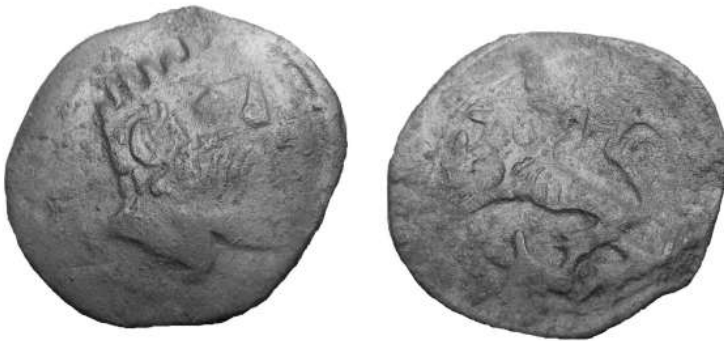
Massa 1,24 g – – Ø 17 mm (collectie auteur) (schaal 200%)

Sedert enkele jaren zie ik in diverse muntcatalogi en op muntbeurzen dat kortes met het gekroond hoofd van Karel V worden aangeboden die niet direct aan een munthuis zijn toe te wijzen. Sommige stukken tonen een slordig gegraveerd hoofd van keizer Karel, en de opschriften ontbreken ( zie de twee onderstaande afbeeldingen ). Hoogstwaarschijnlijk was de vraag – evenals de winst voor de valsmunter – voldoende groot om over te gaan tot deze ‘anonieme’ uitgiften. Vaststellend dat deze stukken met muntstempels van mindere kwaliteit werden geslagen, kunnen we aannemen dat deze niet in de officiële muntateliers werden gemaakt, maar pure vervalsingen zijn.